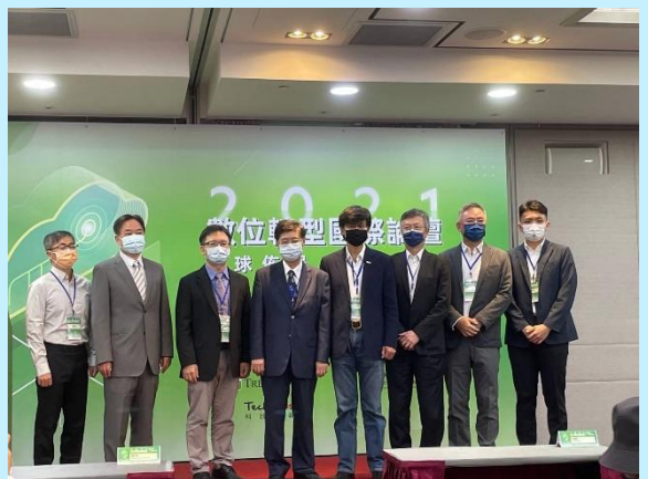
數位轉型國際論壇合照

DTA與集邦科技、科技新報共同舉辦數位轉型國際論壇，負責推動數位發展部的行政院政務委員郭耀煌提到，「數位轉型」不只是產業要轉型，就連國家、社會等都需要關注。數位發展部為了加速國家數位轉型腳步，提出資通安全、資料治理、跨域人才、創新環境及全球運籌等「數位發展新五需」概念。針對數位轉型發展現況，郭政委表示，政府也需擔負責任，希望2022上半年正式成立數位發展部，帶領國家解決數位發展問題。